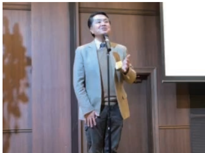
中締め 完賀副会長