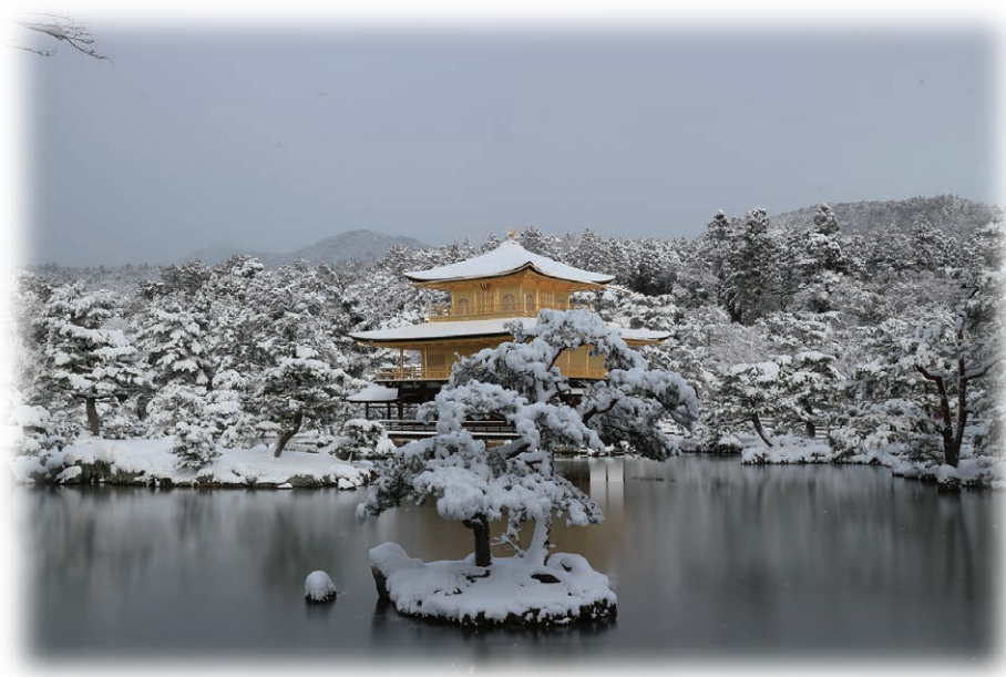
雪の金閣寺